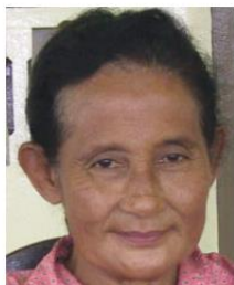
Send us a photo of this people group