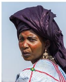
Send us a photo of this people group