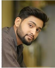
(Representative photo)  Send us a photo of this people group