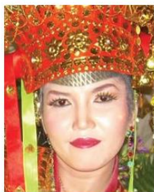
Send us a photo of this people group