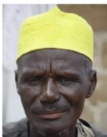
Send us a photo of this people group