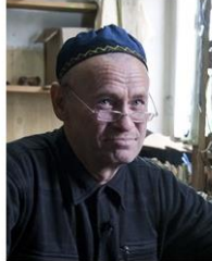
(Representative photo) Send us a photo of this people group