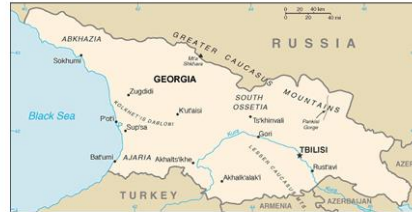
Send us an updated map of this people group