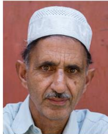
(Representative photo)

* From latest India census data. Current Christian values may substantially differ.