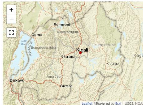
Send us a map of this people group