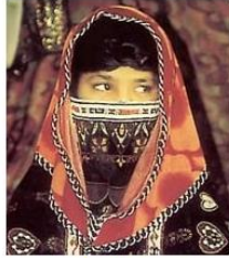
Send us a photo of this people group