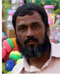
(Representative photo) Send us a photo of this people group