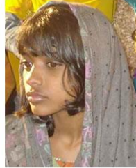
(Representative photo) Send us a photo of this people group