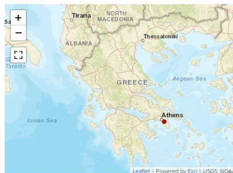
Send us a map of this people group