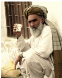
Send us a photo of this people group

* From latest India census data. Current Christian values may substantially differ.