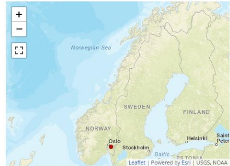
Send us a map of this people group