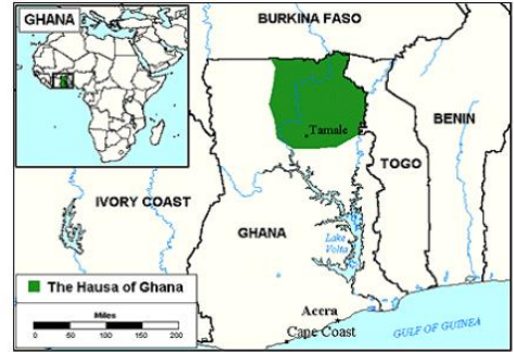
Send us an updated map of this people group