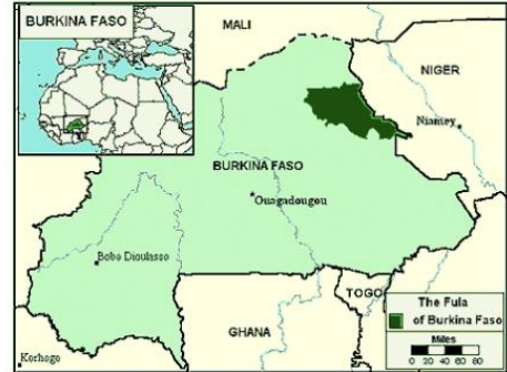
Send us an updated map of this people group