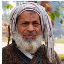
(Representative photo) Send us a photo of this people group

* From latest Pakistan census data. Current Christian values may substantially differ.