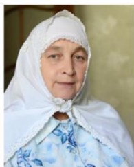
Photo Source: Copyrighted © 2022 Shamilini - Shutterstock. All rights reserved. Used with permission. Send us a photo of this people group