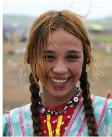
Send us a photo of this people group