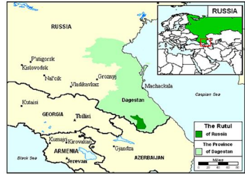
Send us an updated map of this people group