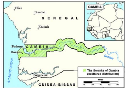
Send us an updated map of this people group