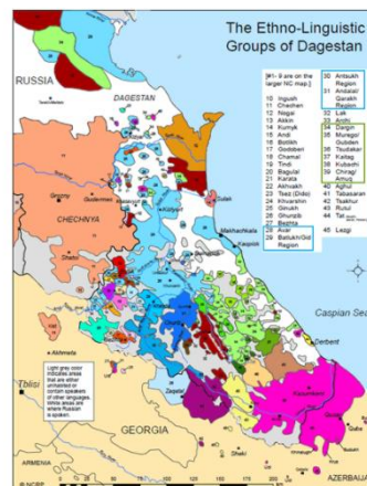
Send us an updated map of this people group