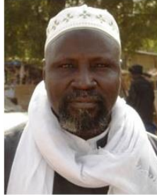
Send us a photo of this people group