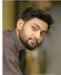
(Representative photo) Photo Source: Muzaffar Sohno - Pixabay Send us a photo of this people group