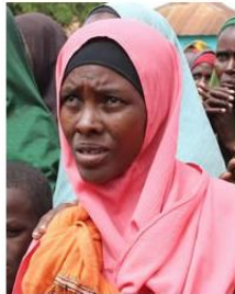
(Representative photo)