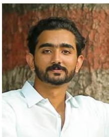
(Representative photo)

* From latest India census data. Current Christian values may substantially differ.