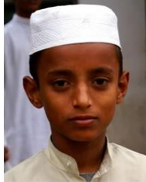
(Representative photo) Photo Source: Copyrighted © 2023 Isudas. All rights reserved. Used with permission