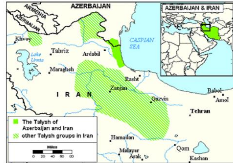
Send us an updated map of this people group