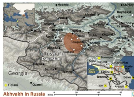
Map Source: People Group Location from IMB. Other map data / geography from GMI. Map by Joshua Project.