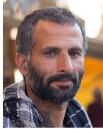
(Representative photo) Send us a photo of this people group