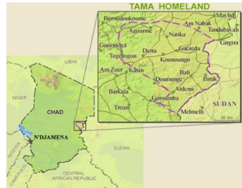
Map Source: Anonymous Send us an updated map of this people group