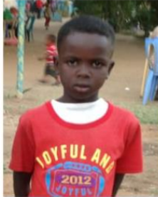
Send us a photo of this people group