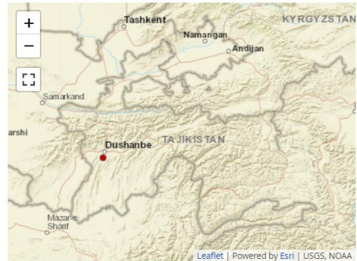
Send us a map of this people group