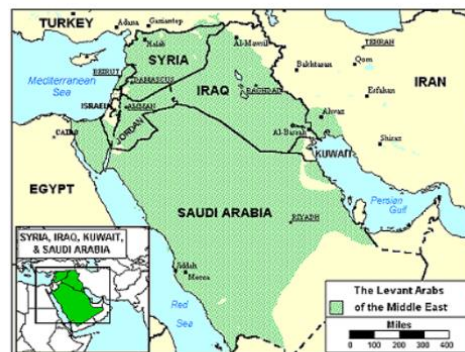
Send us an updated map of this people group