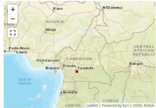
Send us a map of this people group