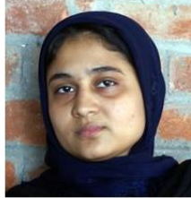
(Representative photo)