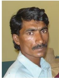
(Representative photo)