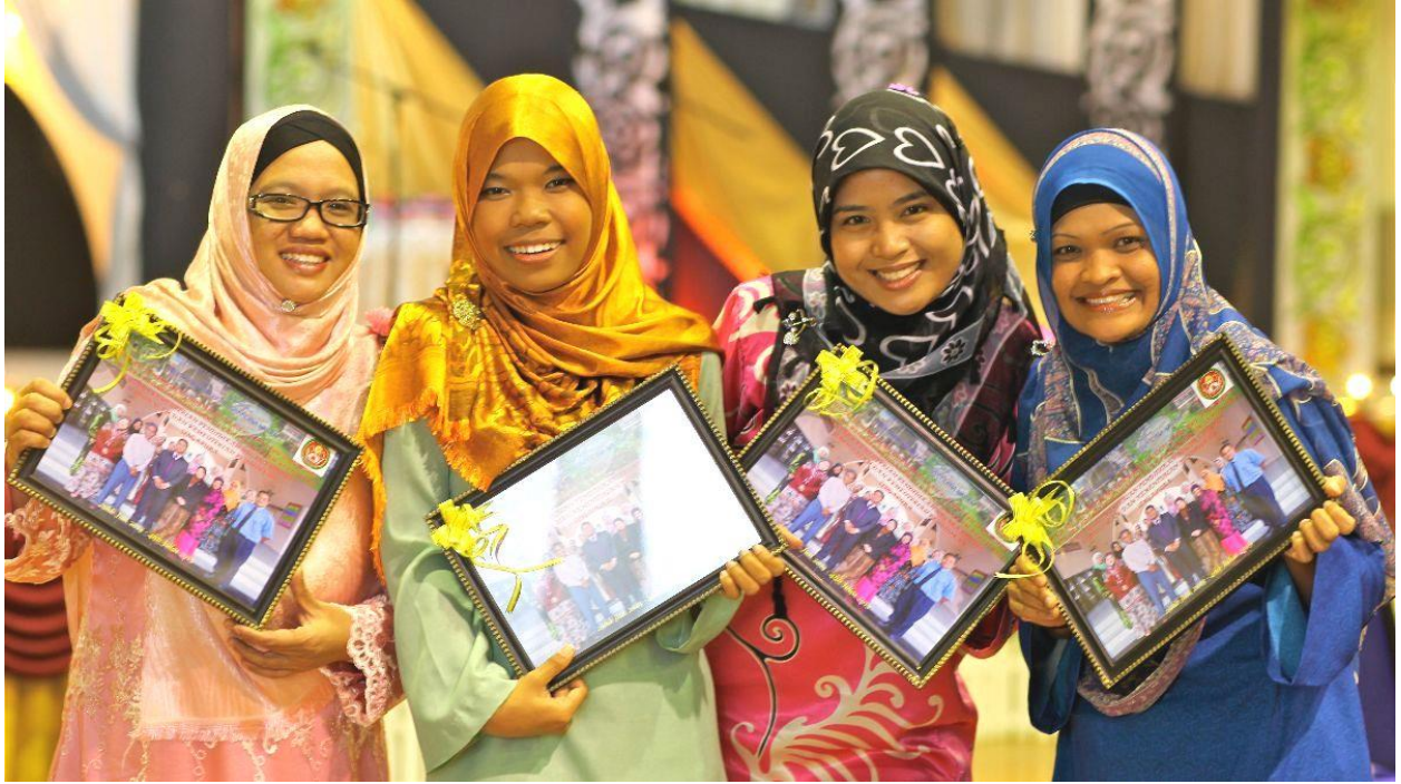
在文莱达鲁萨兰国大学（简称文莱大学）举行会议后的教师