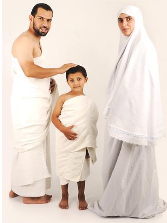
一个年轻的家庭展示他们朝觐的戒服