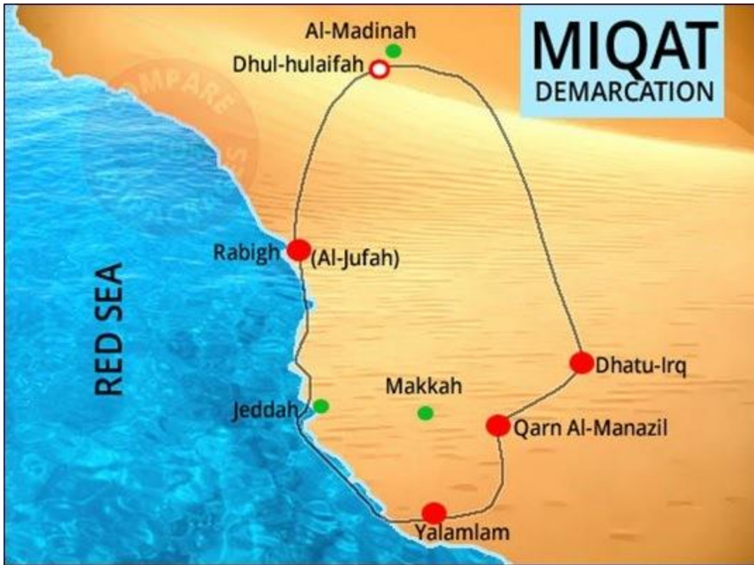
上图显示了麦加周围的边界，在穿越之前必须开始 Ihram。朝圣者必须从红点指定的五个检查站之一开始