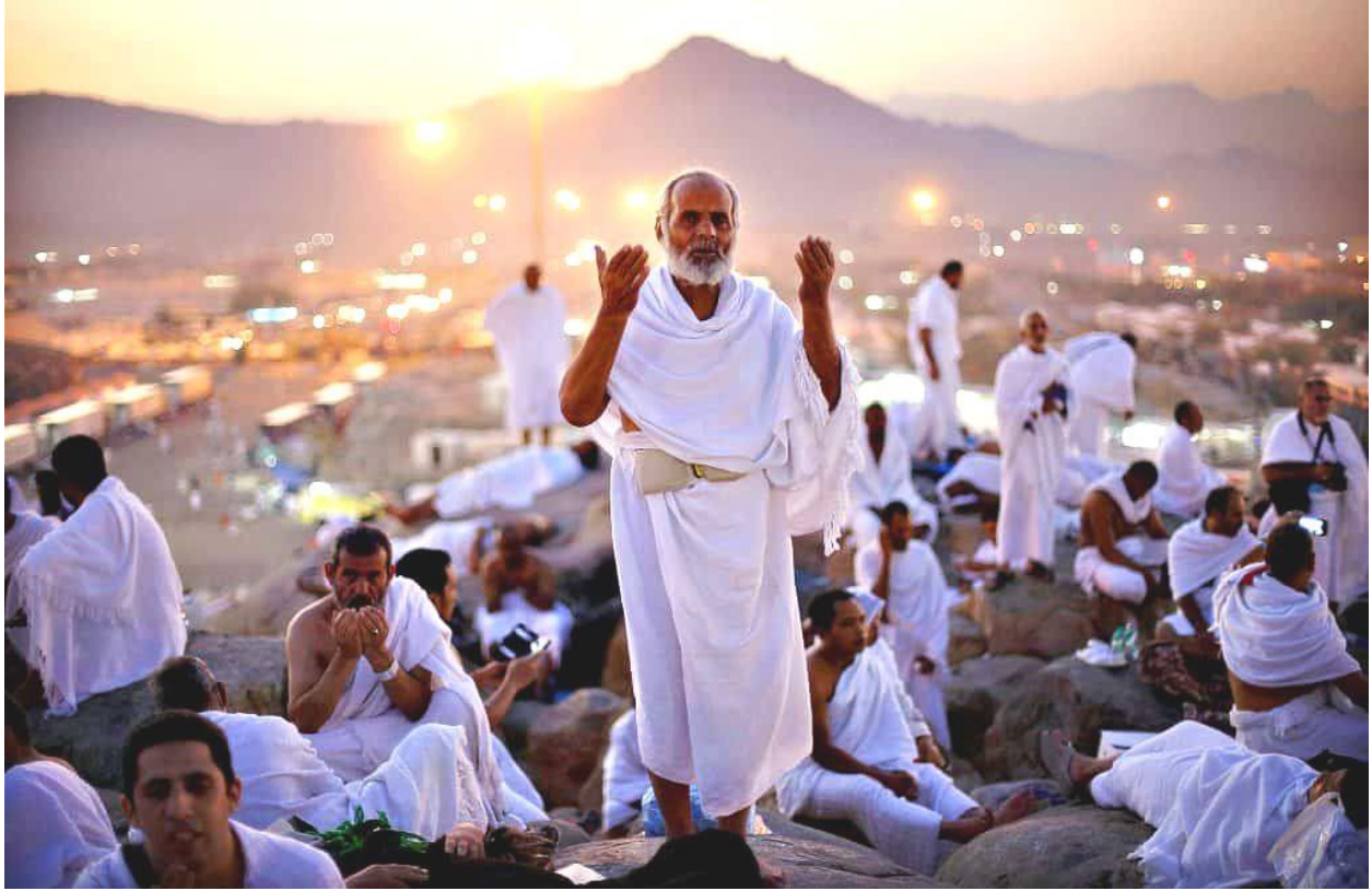
一群穿着戒衣的朝觐男子