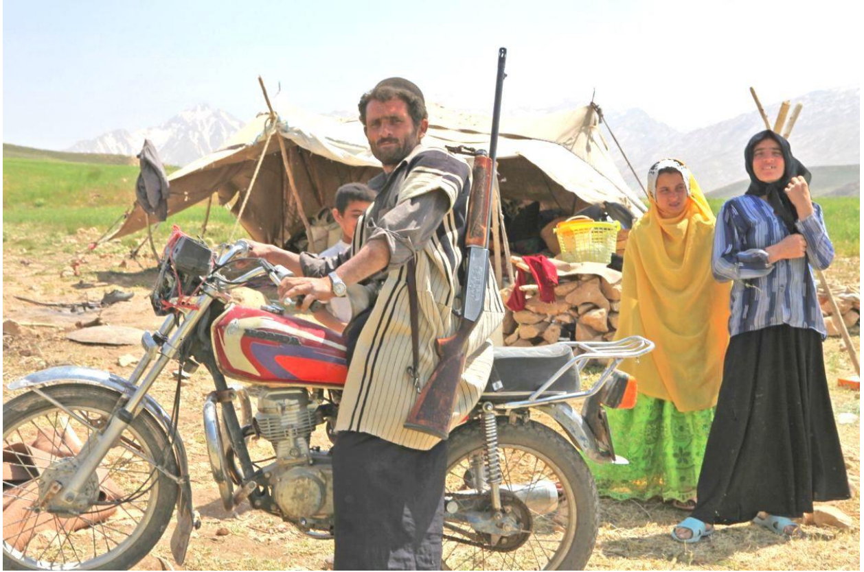
即便像巴赫蒂这样的游牧民族也能骑着摩托到处走