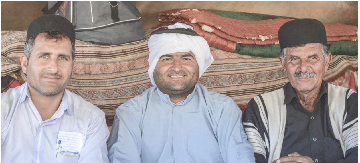
聚在一处的巴赫蒂男子