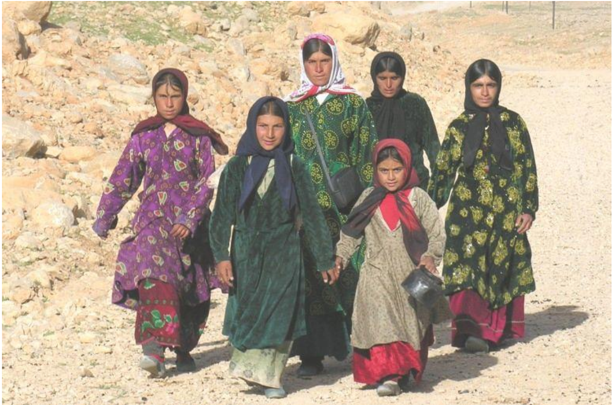
从山上下来的—家巴赫蒂人