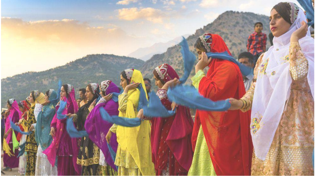
巴赫蒂婚礼的场景