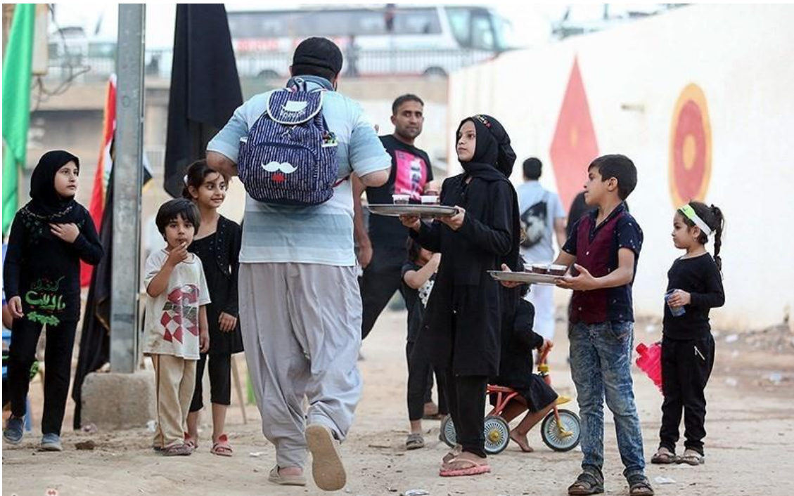
上面四张图：孩子们也参与阿尔巴朝圣节 - 甚至为旅行者提供一些免费食物。