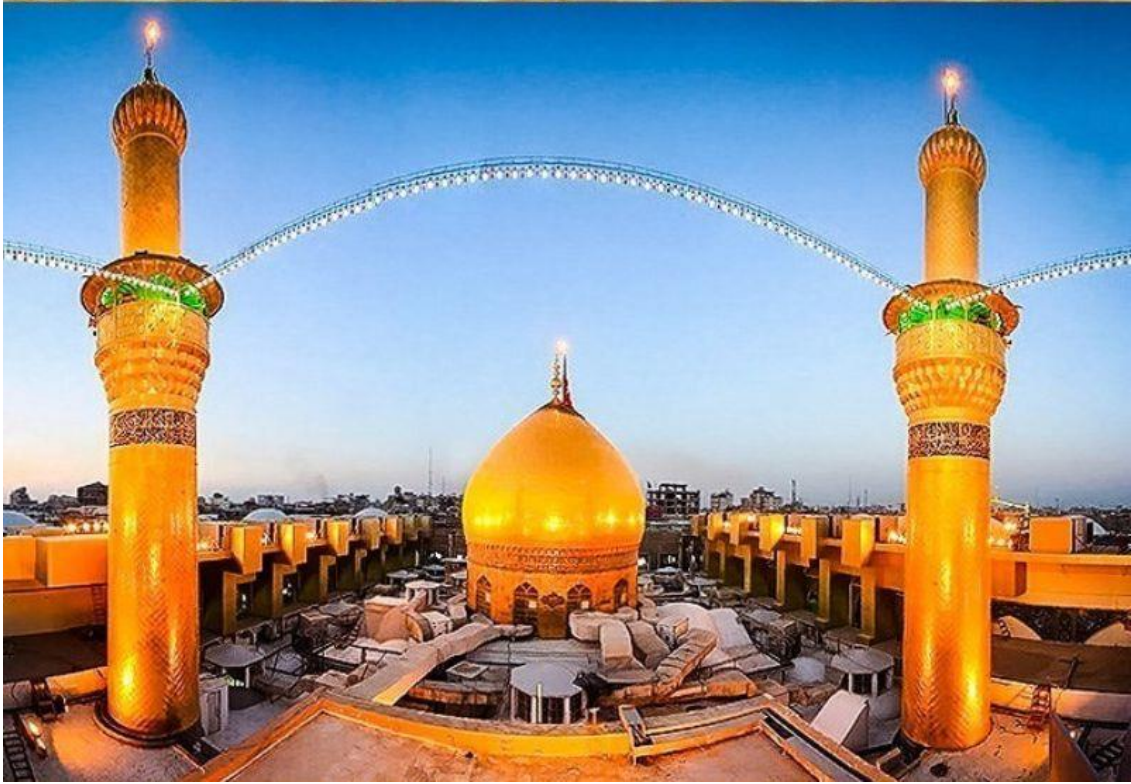
(上图) 伊拉克卡尔巴拉的伊玛目侯赛因神社，侯赛因·伊本·阿里的墓葬在此。他在卡尔巴拉战役中丧生的同伴被埋葬在他的坟墓附近。