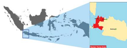
Send us an updated map of this people group