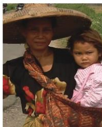
Send us a photo of this people group