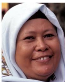
Send us a photo of this people group